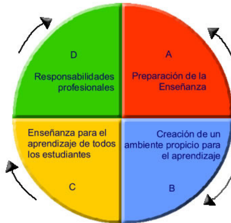
Ciclo del Proceso Enseñanza Aprendizaje